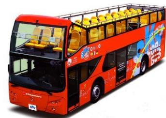
2階建てオープンバス「スカイバス」